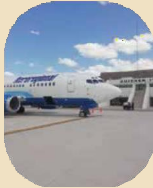
A.I. DE CHICHÉN-ITZÁ